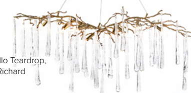
Svietidlo Teardrop, John-Richard