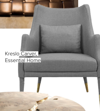
Kreslo Carver, Essential Home