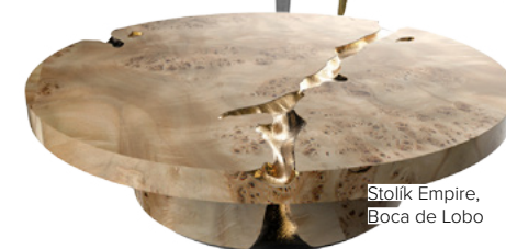
Stolík Empire, Boca de Lobo